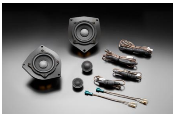
ソニックデザイン スピーカーパッケージ「SP-F30E」 フロント専用 (F30系 BMW3 シリーズ専用スタンダードモデル、ネットワーク付属)