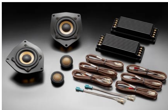
ソニックデザイン スピーカーパッケージ「SP-F30F」 フロント専用 (F30系 BMW3 シリーズ専用トップグレードモデル、ネットワーク付属)