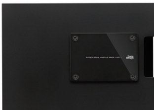
B80R 77mm スーパーバスモジュール 本体価格 380,000円 (1台) +税